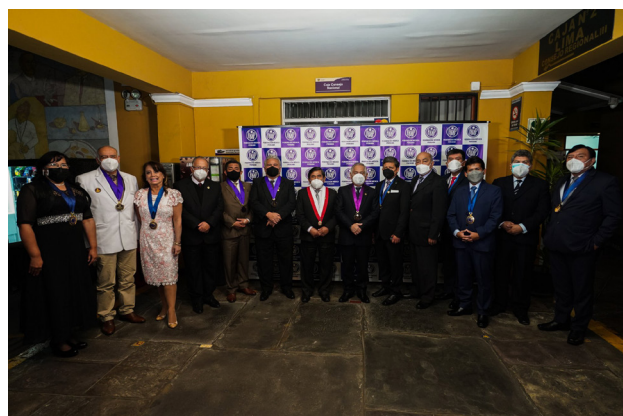
75 Aniversario de la FMP.