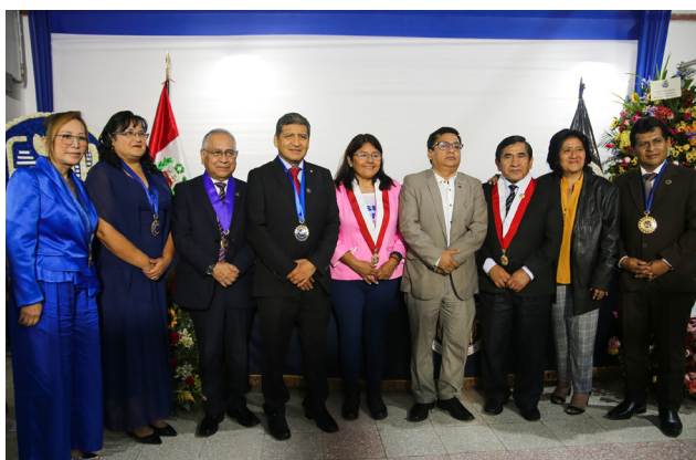
76 Aniversario de la FMP.