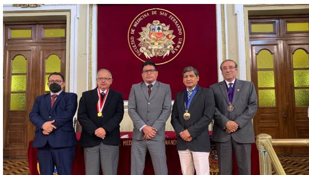
Simposio: Retos del Sistema de Salud en la Pospandemia. UNMSM y FMP.